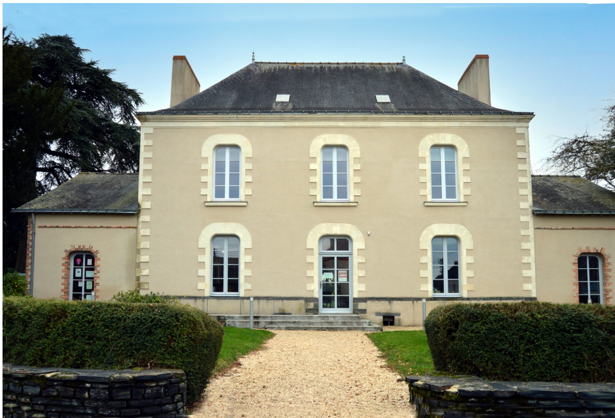
Manoir de la Renaudière